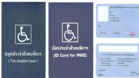
ตัวอย่างบัตรและสมุดประจำตัวคนพิการ