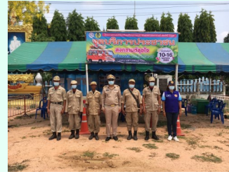
จัดทำโดย งานประชาสัมพันธ์ สำนักปลัด เทศบาลตำบลบึงสำโรง

สำนักงานเทศบาลตำบลบึงสำโรง เลขที่ 59 หมู่ที่ 3 ตำบลบึงสำโรง อำเภอแก้งสนามนาง จังหวัดนครราชสีมา 30440