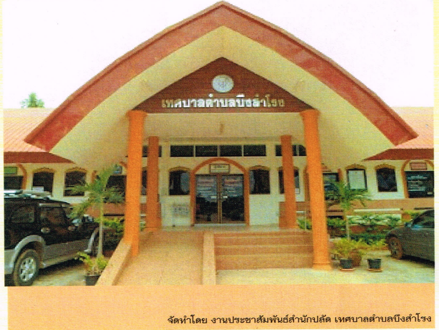
จัดทำโดย งานประชาสัมพันธ์สำนักปลัด เทศบาลตำบลบึงสำโรง

สำนักงานเทศบาลตำบลบึงสำโรง เลขที่ 59 หมู่ที่ 3 ตำบลบึงสำโรง อำเภอแก่งสนามนาง จังหวัดนครราชสีมา 30440