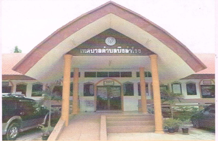
จัดทำโดย งานประชาสัมพันธ์สำนักปลัด เทศบาลตำบลบึงสำโรง

สำนักงานเทศบาลตำบลบึงสำโรง เลขที่ 59 หมู่ที่ 3 ตำบลบึงสำโรง อำเภอแก่งสนามนาง จังหวัดนครราชสีมา 30440