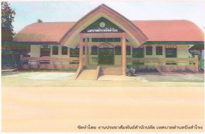
จัดทำโดย งานประชาสัมพันธ์สำนักปลัด เทศบาลตำบลบึงสำโรง

สำนักงานเทศบาลตำบลบึงสำโรง เลขที่ 59 หมู่ที่ 3 ตำบลบึงสำโรง อำเภอแก่งสนามนาง จังหวัดนครราชสีมา 30440